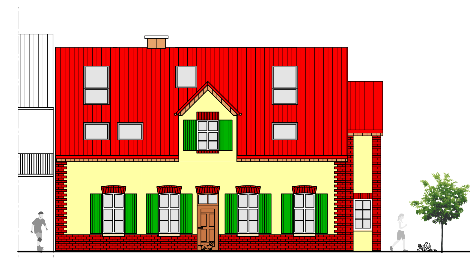
Ansicht Norden Umbau