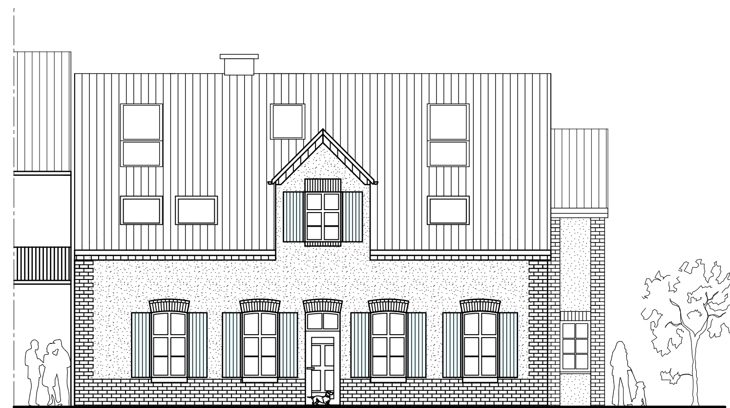
Ansicht Norden Umbau